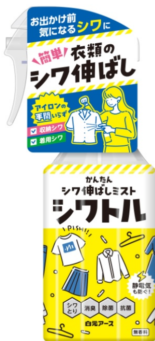
衣類のシワ伸ばしミスト シワトル