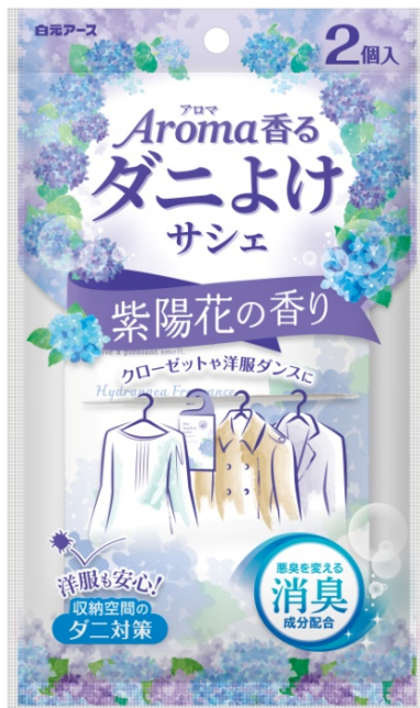
アロマ香る ダニよけサシェ 紫陽花の香り