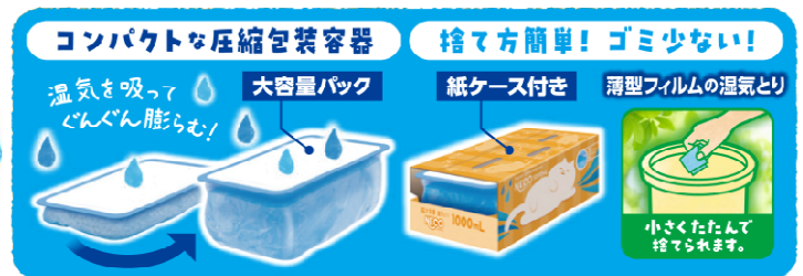
ドライ&ドライUP NEO 金木犀の香り 1000mL