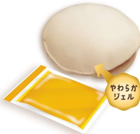
レンジでゆたぽん もちっとホットクッション